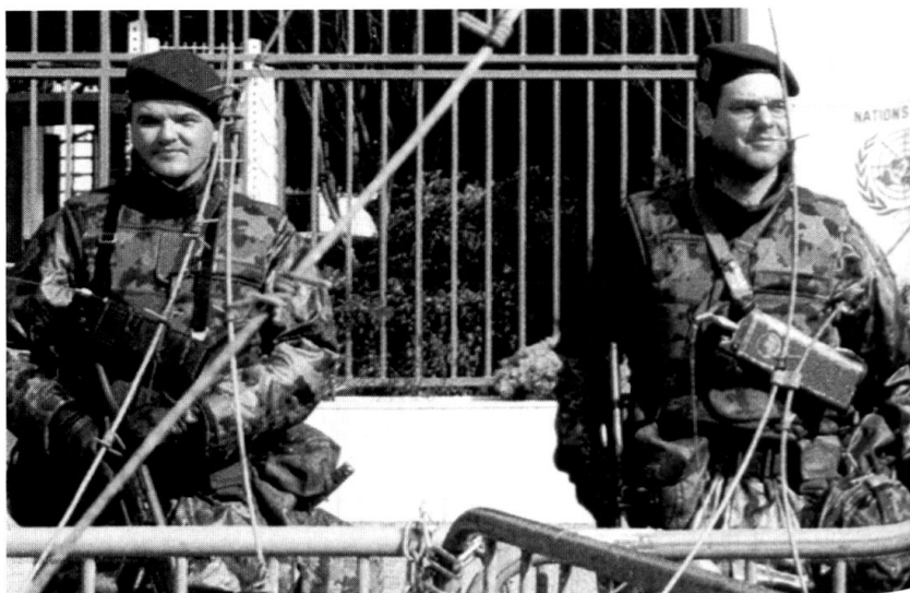
Service de surveillance aux Nations unies à Genève.

Dans la mesure où la situation de février – mars 1999 se répéterait (engagements subsidiaires d'appui au profit des re-