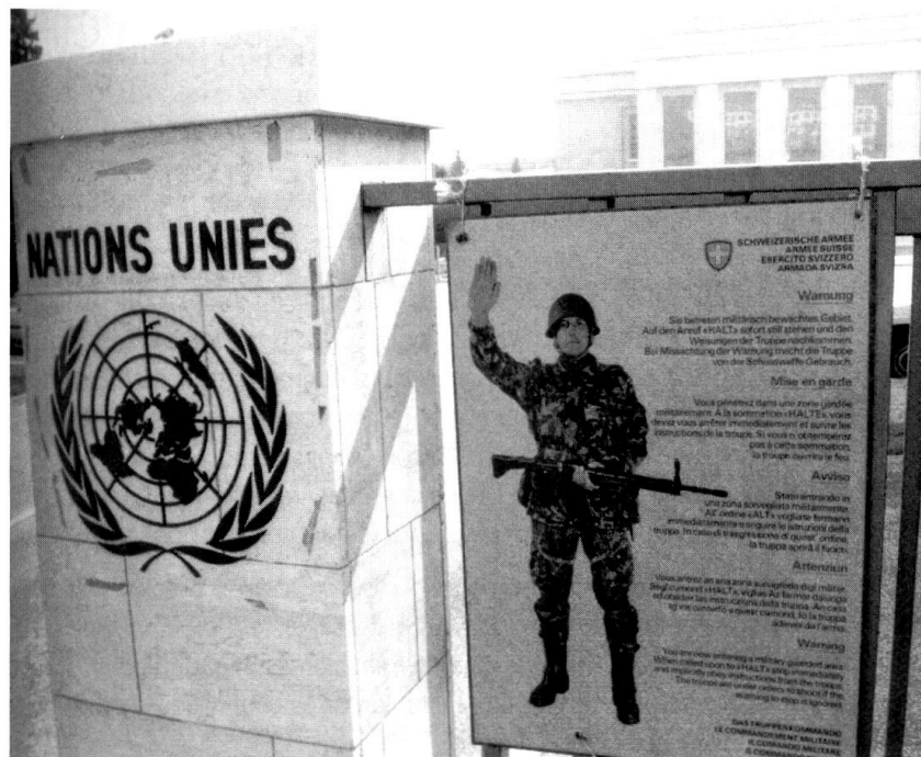
Des formes de collaboration nouvelles: service de garde à l'ONU, à Genève.

Les risques et dangers dans le domaine des Soft Security Issues (crime organisé, terrorisme, prolifération, environnement), qui attaquent la société aux défauts de sa cuirasse, s'ajoutent aux menaces militaires. Les attentats du 11 septembre en sont la démonstration. Dès lors, la sécurité doit être appréhendée